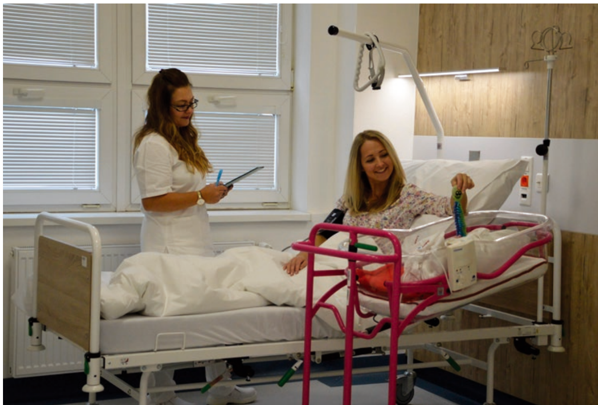
Nemocnica Zvolen zrekonštruovala gynekologicko-pôrodnické a novorodenecké oddelenie

Investícia do zakúpenia nového RTG skiagrafického prístroja predstavovala viac ako 117 tisíc EUR. Nemocnica Zlaté Moravce zakúpila modernú medicínsku techniku v hodnote takmer 14 tisíc EUR. Nový pľúcny ventilátor je určený pre intenzívnu starostlivosť o pacientov a pre pacientov s chronickým zlyhávaním dýchania, ktorý dokáže úplne alebo čiastočne nahradiť funkciu pľúc. Nová prístrojová technika je určená na umelú ventiláciu dospelých ako aj pediatrických pacientov.