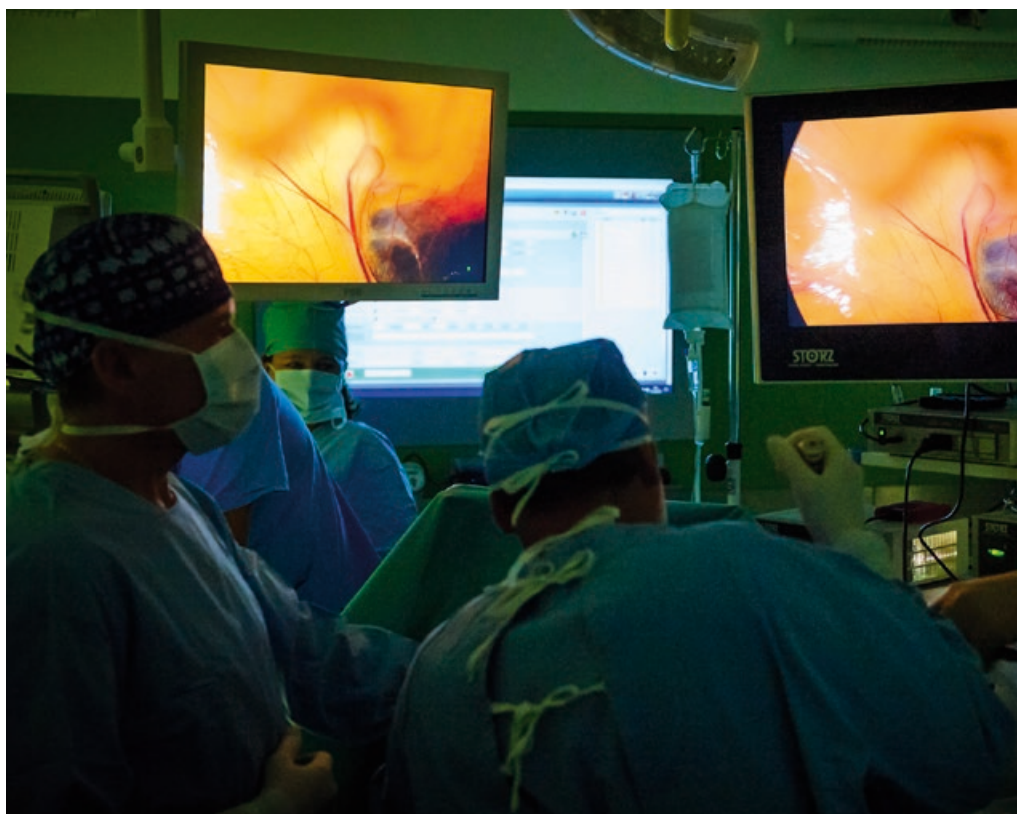
Chirurgická klinika Nemocnice Košice-Šaca obohatila operatívu o bariatrické zákroky

Nemocnica Zlaté Moravce a.s. 14. marca 2018 slávnostne otvorila obnovené rádiologické oddelenie. Oddelenie vzniklo vďaka kompletnej rekonštrukcii, ktorá si vyžiadala finančné prostriedky v hodnote takmer 150 tisíc EUR.