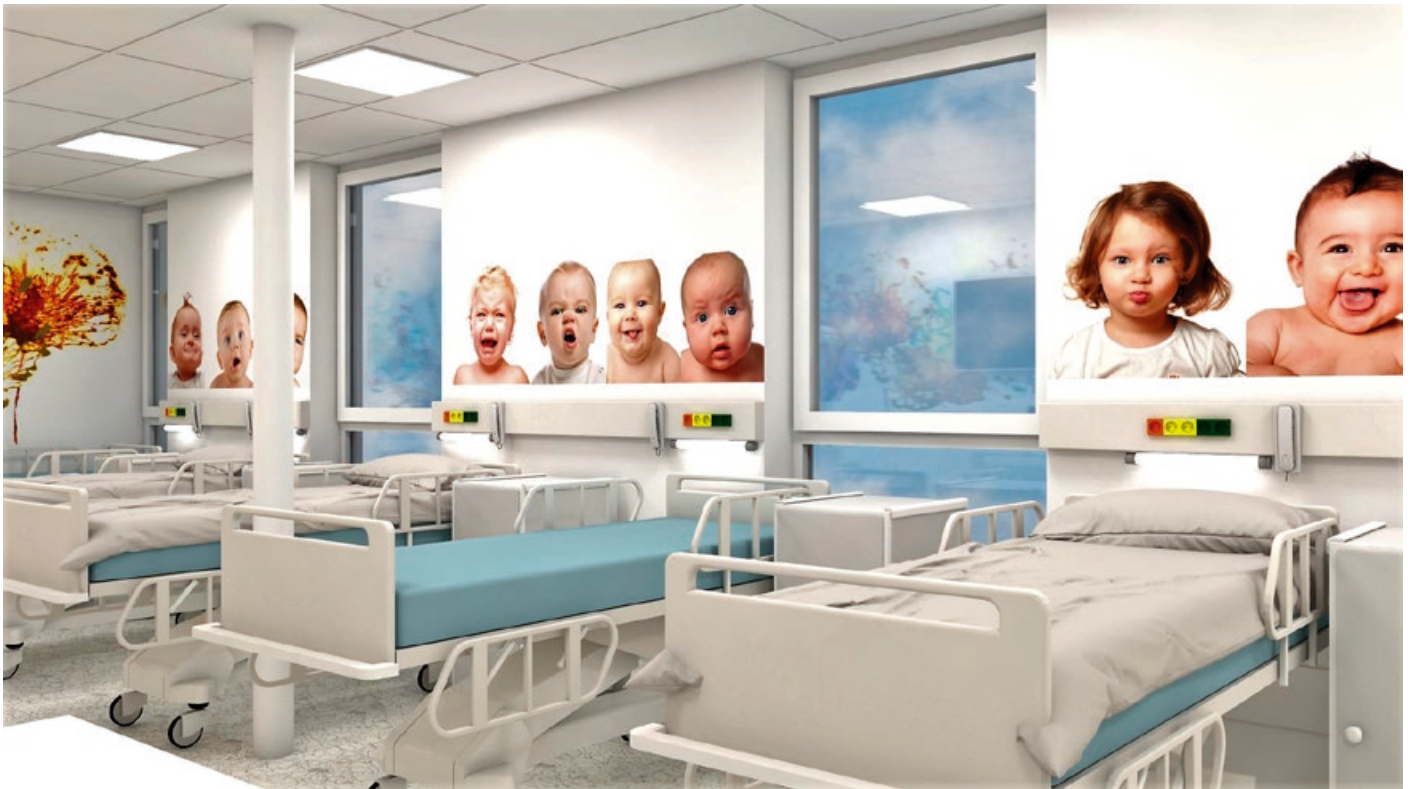
Nemocnica Košice-Šaca spustila v roku 2018 veľkú rekonštrukciu pôrodnice